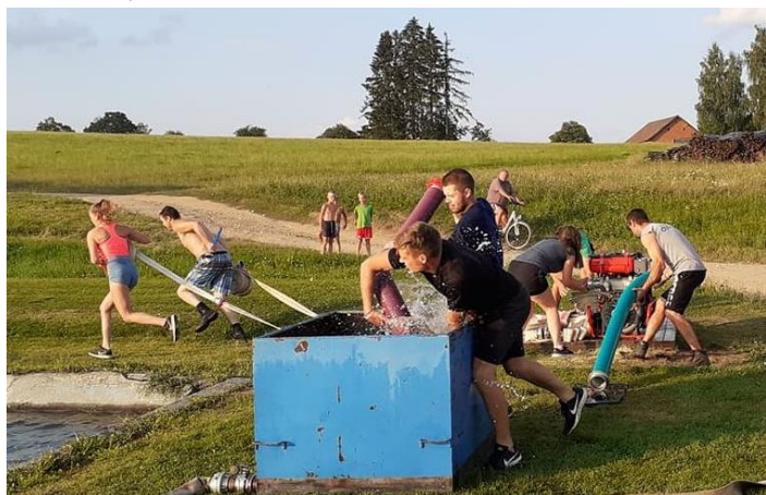
Trénink na noční soutěž ve Vortově.