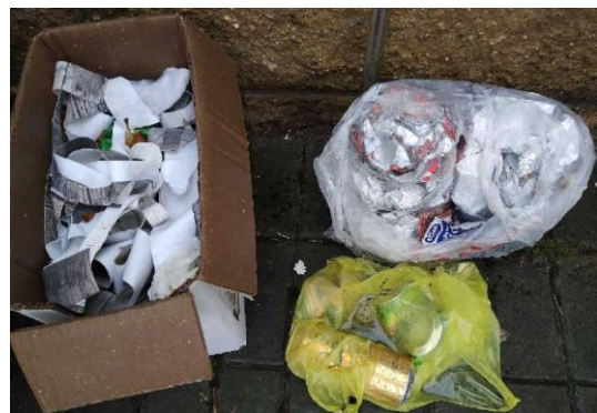
Nepořádek u kontejnerů.