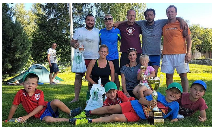
Volejbalový turnaj – vítězné družstvo: VR.

Členům SDH a dětem do 15 let přispěje sbor 200 Kč/osoba.