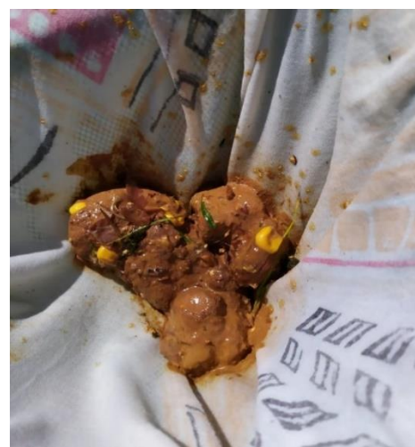
Lidská potřeba v koupališti.

ROČNÍK XIV. – VYDÁNO: 28. 8. 2020 MĚSÍČNÍK - ČÍSLO: 9. - Uzávěrka příštího čísla 25. 9. 2020.