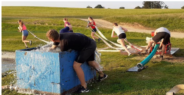
Trénink na noční soutěž ve Vortové.